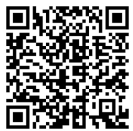
X500server 3D demo